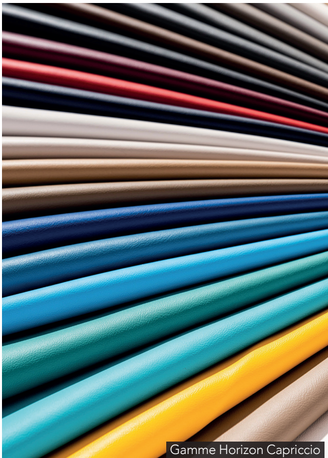
Gamme Horizon Capriccio