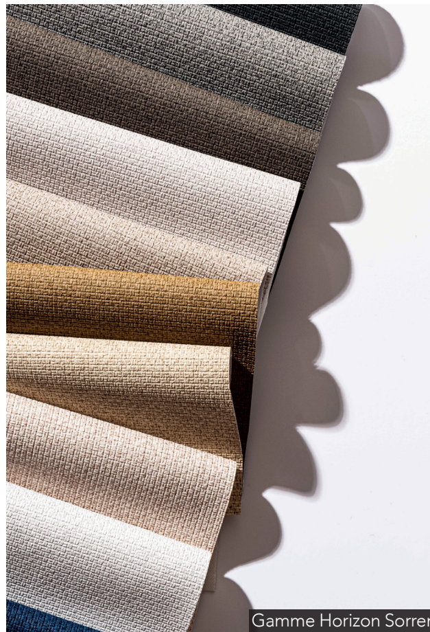
Gamme Horizon Sorrento